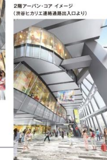
2階アーバン・コア イメージ（渋谷ヒカリエ連絡通路出入口より）