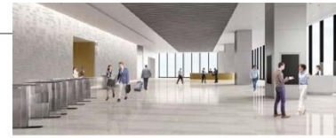
オフィスロビーイメージ