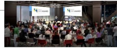
SHIBUYA QWS SCRAMBLE HALL イメージ