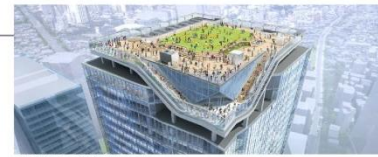
SHIBUYA SKY 俯瞰イメージ