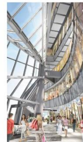
3階アーバン・コア イメージ（西側より）