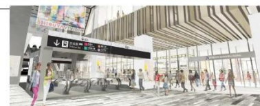
1階アーバン・コア イメージ（北側より）