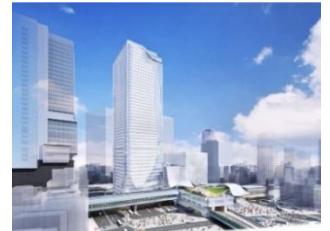
▲渋谷スクランブルスクエア（宮益坂交差点方面よりのぞむ）