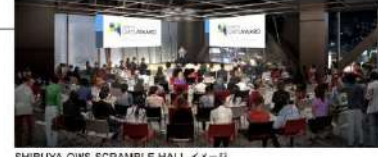
SHIBUYA QWS SCRAMBLE HALL イメージ