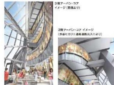
3階アーバンコア イメージ (西側より)