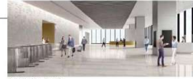
オフィスロビーイメージ