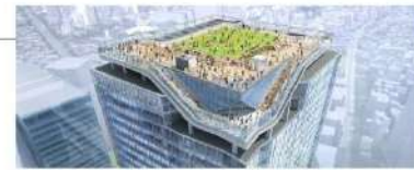
SHIBUYA SKY 展望イメージ