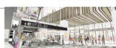
1階アーバンコア イメージ (北側より)