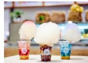
▲Trueberry× NEO CLOUD コラボレーションメニュー

<本件に関する報道関係者さまからのお問合せ先> 渋谷スクランブルスクエア PR 事務局（株式会社サニーサイドアップ内） 担当：小池、正山、福井、岩崎 TEL：03-6894-3200 FAX：03-5413-3050 E-mail： scramble_square_pr@ssu.co.jp