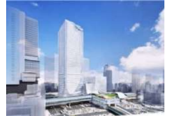
▲渋谷スクランブルスクエア (宮益坂交差点方面よりのぞむ)