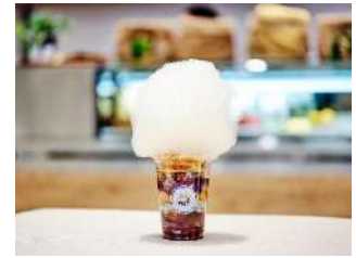
▲Cloud parfait (お芋&アップルシナモン)

大学芋やアップルシナモンをベースに紫芋ペーストや豆乳アイス、スーパーフードなどが何層にもわたる、見た目も味も飽きさせないパフェです。