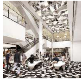
▲L×7(エル バイ セブン)