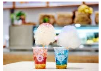
▲左：Cloud juice (克蘭ベリージンジャー)、 右：Cloud juice (ブルーグリーンアルジー)

ブルーグリーンアルジーとレモネードでさわやかな味に仕上げています。綿あめには、バタフライピーのパウダーをかけて、青空をイメージしています。