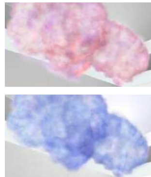
▲「NEO CLOUD」の 点灯イメージ