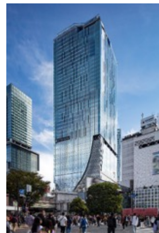
▲渋谷スクランブルスクエア外観

名称： 渋谷スクランブルスクエア／SHIBUYA SCRAMBLE SQUARE 事業主体： 東急(株)、東日本旅客鉄道(株)、東京地下鉄(株) 所在： 東京都渋谷区渋谷2丁目24番12号 用途： 事務所、店舗、展望施設、駐車場など 延床面積： 第Ⅰ期(東棟)約181,000㎡、第Ⅱ期(中央棟・西棟)約96,000㎡ 階数： 第Ⅰ期(東棟)地上47階 地下7階、 第Ⅱ期(中央棟)地上10階 地下2階、(西棟)地上13階 地下5階 高さ： 第Ⅰ期(東棟)229.7m、第Ⅱ期(中央棟)約61m、(西棟)約76m 設計者： 渋谷駅周辺整備計画共同企業体 ※(株)日建設計、(株)東急設計コンサルタント、(株)JR東日本建築設計、 メトロ開発(株) デザイン-アキオ： (株)日建設計、(株)隈研吾建築都市設計事務所、(有)SANAA 事務所 運営会社： 渋谷スクランブルスクエア(株) ※東急(株)、東日本旅客鉄道(株)、東京地下鉄(株)の3社共同出資 開業： 第Ⅰ期(東棟)2019年11月1日 第Ⅱ期(中央棟・西棟)2027年度(予定) URL： https://www.shibuya-scramble-square.com