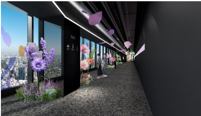
▲展示イメージ 46階屋内展望回廊全体にアートフラワーが広がります