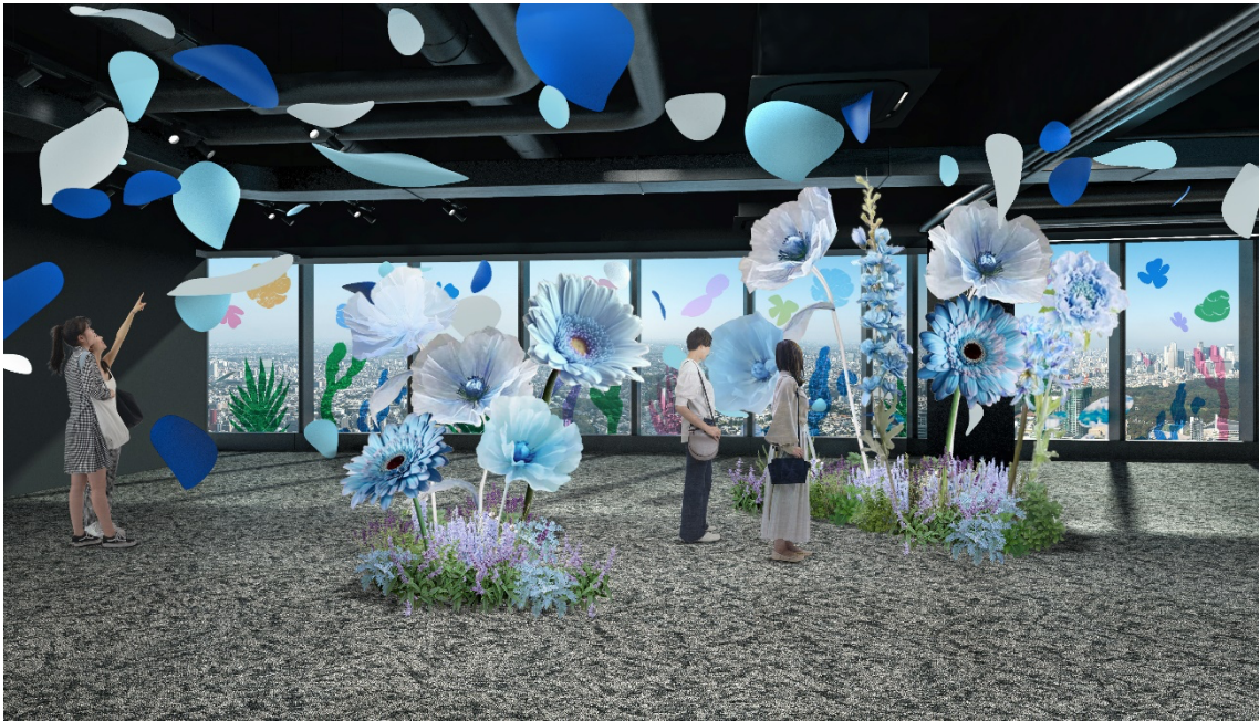
▲展示イメージ 回廊を数々のアートフラワーが誘います

昨年の「BOTANICAL VIEW」のフォトスポットエリアとして好評を頂いた、アートフラワー装飾を発展させ、「FLOWer View」と題して、46階 SKY GALLERY の回廊に色彩豊かな巨大アートフラワーを多数設置。天空の花の遊歩道を演出、さらに天面には進行方向に沿って花びらが舞い、より立体的に空間を彩ります。高さ最大 2m の巨大アートフラワーと、景色の変化を楽しみながら回遊する SHIBUYA SKY でしか体験することのできない、期間限定の特別な空間を演出します。