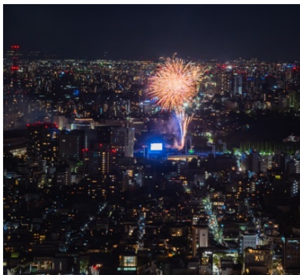
▲屋上展望空間「SKY STAGE」からの花火の様子 ※2023 年 8 月撮影