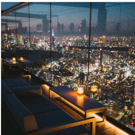
▲「THE ROOF SHIBUYA SKY」ソファ席