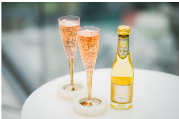
▲コットンキャンディシャワー