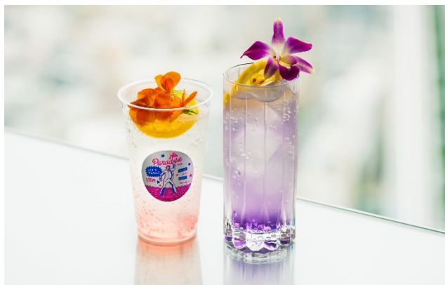
▲（左）フラワースカッシュ、（右）バイオレットフィズ