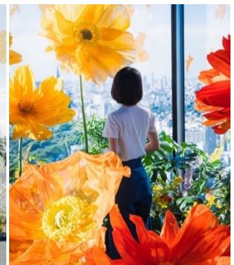
▲2023年夏「BOTANICAL VIEW」 アートフラワーによるフォトスポット