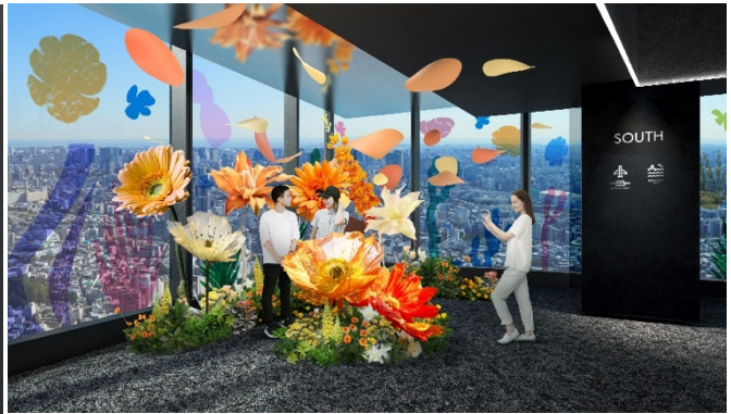
▲フォトスポットイメージ