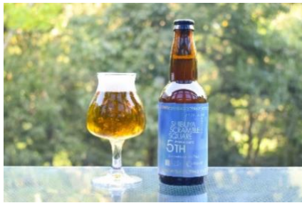
▲オリジナルビール (Anniversary Ale NO.5)