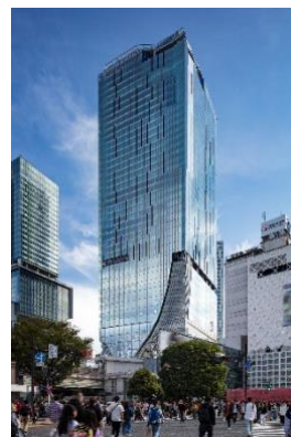
▲渋谷スクランブルスクエア外観

名称： 渋谷スクランブルスクエア／SHIBUYA SCRAMBLE SQUARE 事業主体： 東急(株)、東日本旅客鉄道(株)、東京地下鉄(株) 所在： 東京都渋谷区渋谷2丁目24番12号 用途： 事務所、店舗、展望施設、駐車場など 延床面積： 第Ⅰ期(東棟)約181,000㎡、第Ⅱ期(中央棟・西棟)約96,000㎡ 階数： 第Ⅰ期(東棟)地上47階地下7階、 第Ⅱ期(中央棟)地上10階地下2階、(西棟)地上13階地下5階 高さ： 第Ⅰ期(東棟)約229.7m、第Ⅱ期(中央棟)約61m、(西棟)約76m 設計者： 渋谷駅周辺整備計画共同企業体 ※(株)日建設計、(株)東急設計コンサルタント、(株)JR東日本建築設計、 メトロ開発(株) デザイン・アキテクト： (株)日建設計、(株)隈研吾建築都市設計事務所、(有)SANAA 事務所 運営会社： 渋谷スクランブルスクエア(株) ※東急(株)、東日本旅客鉄道(株)、東京地下鉄(株)の3社共同出資 開業： 第Ⅰ期(東棟)2019年11月1日 第Ⅱ期(中央棟・西棟)2027年度(予定) URL： https://www.shibuya-scramble-square.com