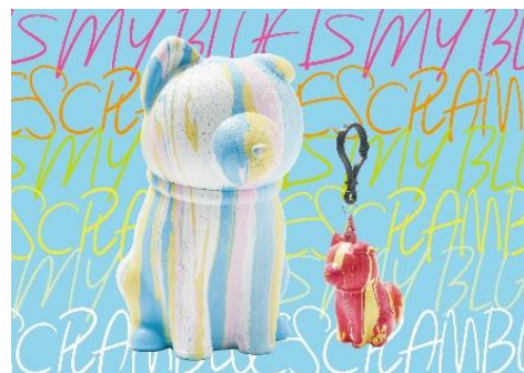
▲ANNIVERSARY 限定ハチ公フィギュア 写真左：通常フィギュアサイズ 写真右：キーホルダーサイズ

予約サイト URL： https://coubic.com/rakugakitokyo/4907651#pageContent