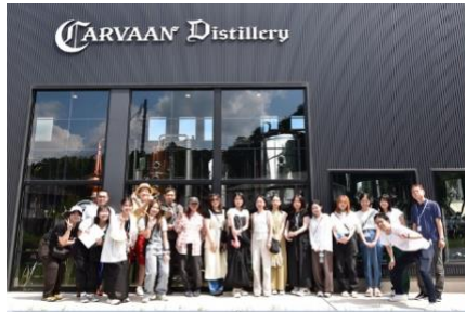
▲CARVAAN 飯能にて店舗や醸造所見学の様子