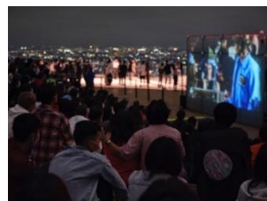
ROOFTOP "LIVE" THEATER