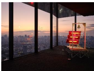
SKY GALLERY EXHIBITION SERIES

多くのカルチャーコンテンツは、イベント当日のSHIBUYA SKY 入場チケット、もしくは年間パスポートでご参加いただけます。本年も企画展「SKY GALLERY EXHIBITION SERIES」や「ROOFTOP 天体観測」などをはじめとする数々のイベントを予定しております。各イベント情報は随時公式サイトにて公開します。