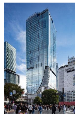
▲渋谷スクランブルスクエア外観

名称：渋谷スクランブルスクエア／SHIBUYA SCRAMBLE SQUARE 事業主体：東急(株)、東日本旅客鉄道(株)、東京地下鉄(株) 所在：東京都渋谷区渋谷 2 丁目 24 番 12 号 用途：事務所、店舗、展望施設、駐車場など 延床面積：第Ⅰ期(東棟)約 181,000 ㎡、第Ⅱ期(中央棟・西棟)約 96,000 ㎡ 階数：第Ⅰ期(東棟)地上 47 階 地下 7 階、 第Ⅱ期(中央棟)地上 10 階 地下 2 階、(西棟)地上 13 階 地下 5 階 高さ：第Ⅰ期(東棟)約 229.7m、第Ⅱ期(中央棟)約 61m、(西棟)約 76m 設計者：渋谷駅周辺整備計画共同企業体 ※(株)日建設計、(株)東急設計コンサルタント、(株)JR 東日本建築設計、 メトロ開発(株) デザイナー：(株)日建設計、(株)隈研吾建築都市設計事務所、(有)SANAA 事務所 運営会社：渋谷スクランブルスクエア(株) ※東急(株)、東日本旅客鉄道(株)、東京地下鉄(株)の 3 社共同出資 開業：第Ⅰ期(東棟)2019 年 11 月 1 日 第Ⅱ期(中央棟・西棟)2031 年度(予定) URL： https://www.shibuya-scramble-square.com